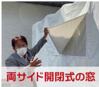
両サイド開閉式の窓